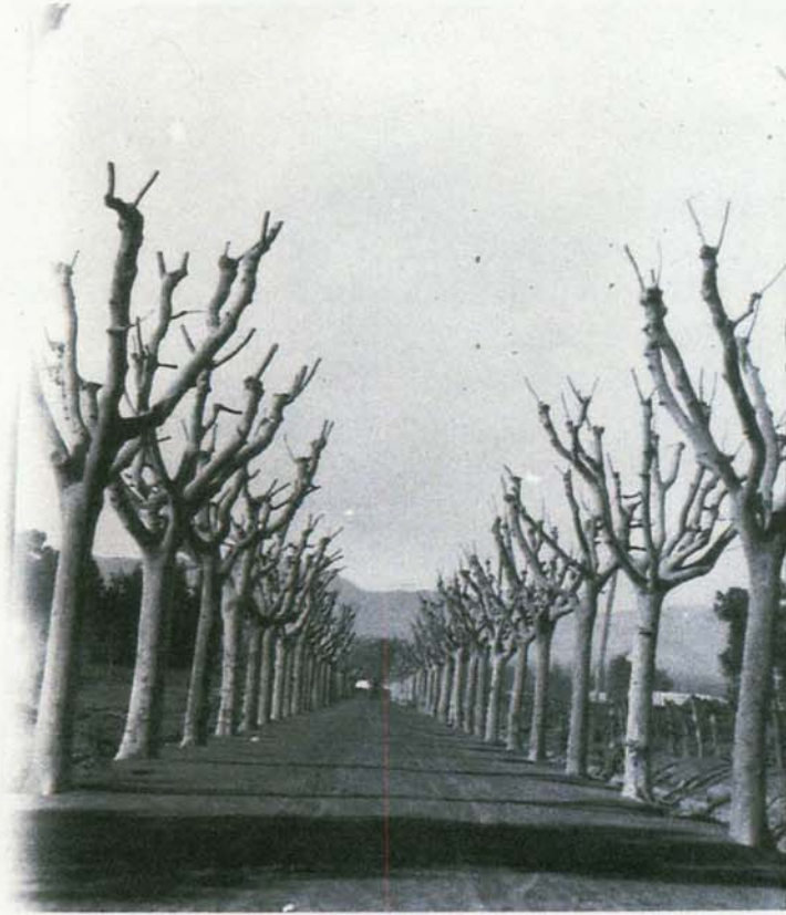
AVENIDA DE LOS PLÁTANOS , (alrededor de 1930) .