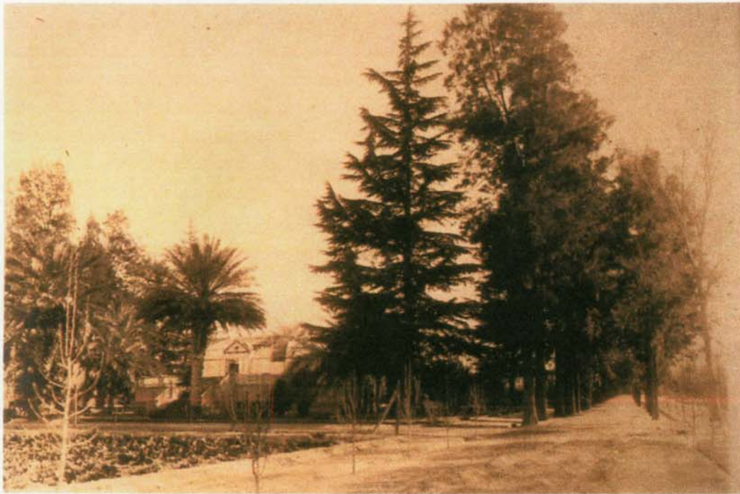
CALLE DE LAS CASUARINAS II , foto 1916. A la izquierda el invernadero.