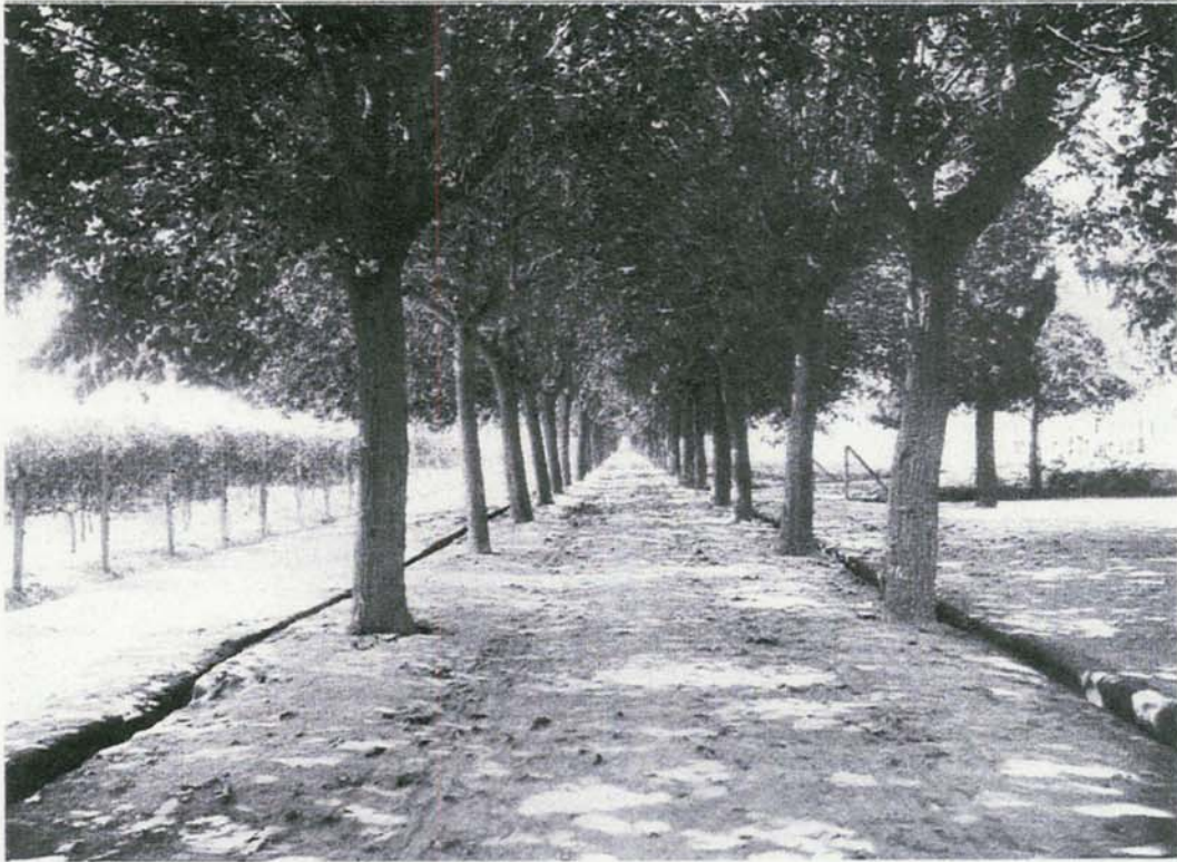
AVENIDA DE LAS MORERAS, en 1927.