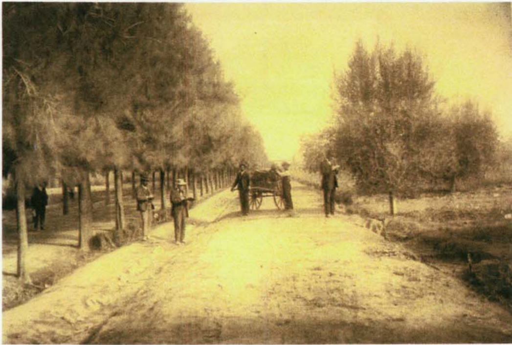
OLIVOS DE LA QUINTA AGRONÓMICA (derecha de la imagen), foto 1910.