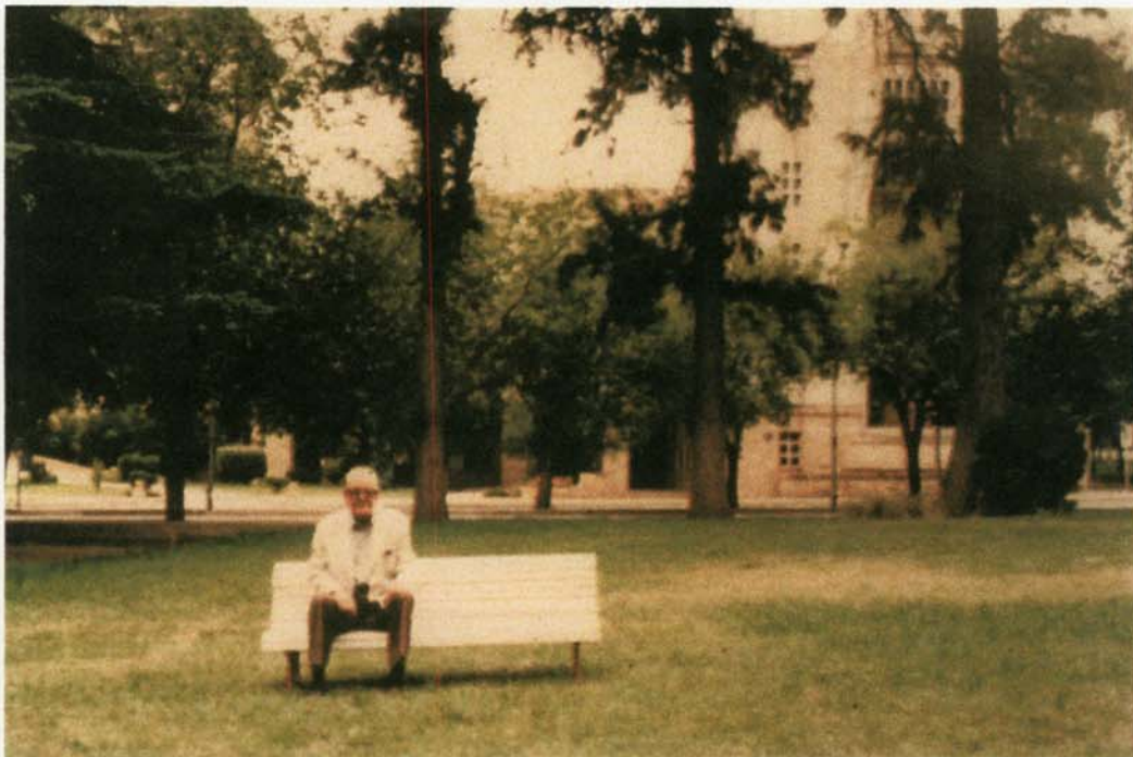
CASUARINAS I , atrás sección rentas de Casa de Gobierno