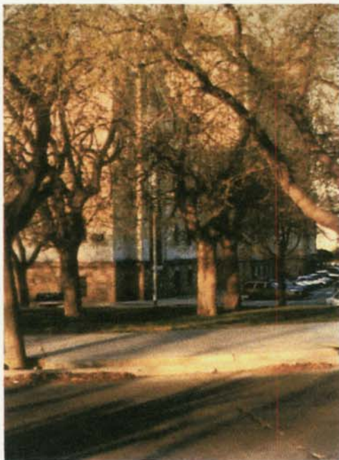
Últimos tres ejemplares en el vértice sur-oeste de la Casa de Gobierno.