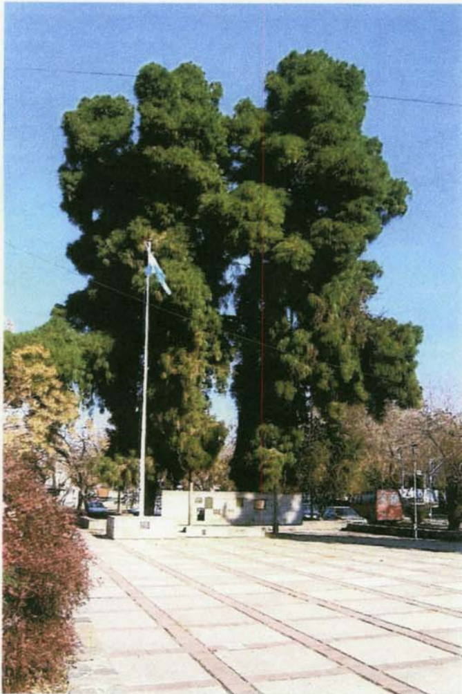
Imagen actual, desde la explanada de ingreso al Palacio Policial en calle Belgrano.