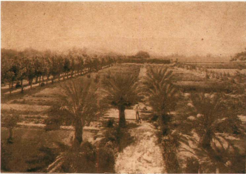
PALMERAS DEL GÉNERO PHOENIX , fotografía 1908. A la izquierda, calle de los plátanos a la derecha, pequeñas, el sendero de la casuarinas .