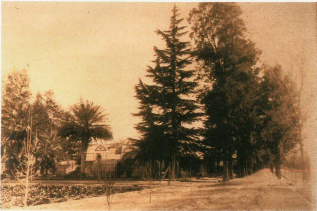
CEDROS (cuatro originales), ornamentaban el entorno del invernadero, a la derecha calle de las casuarinas .