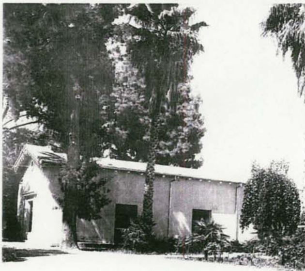
PINOS CANARIOS (en 1933), atrás del edificio.