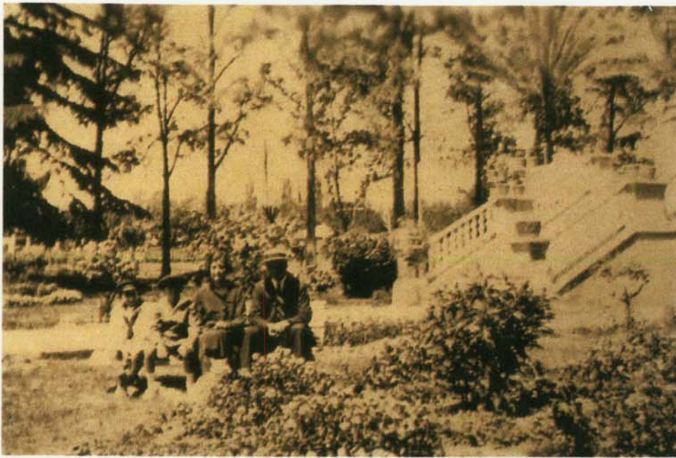
CASUARINAS I ( atrás) foto 1926 .