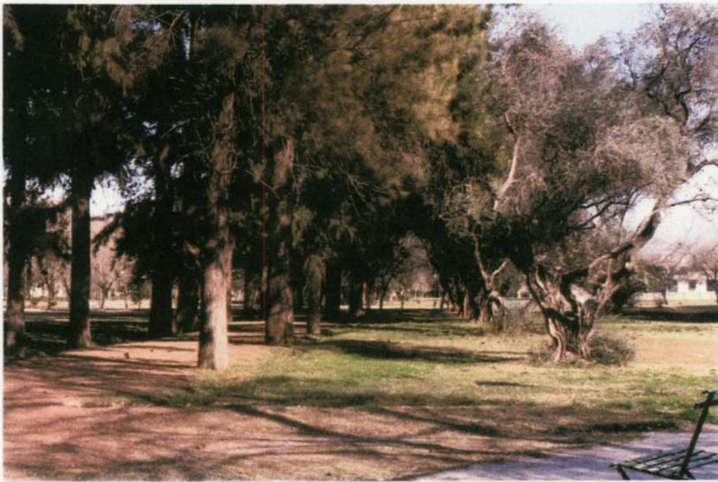
Imagen actual, a la izquierda calle casuarinas II, al fondo calle La Pampa.