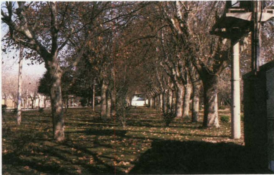
PLATANOS ,foto actual .