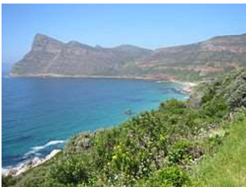
Cabo de Buena Esperanza